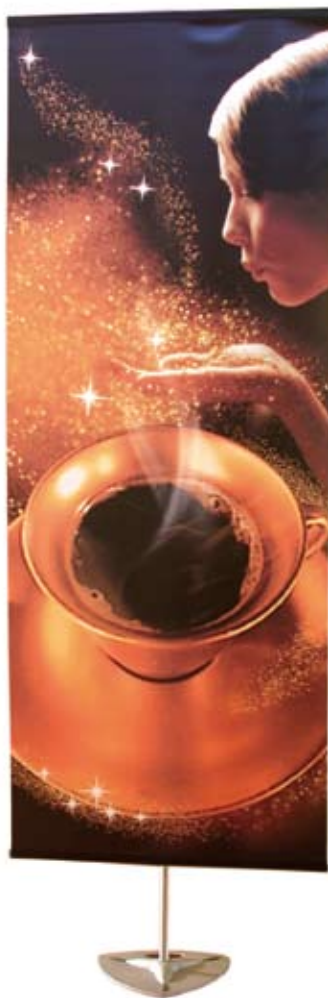
Chronoexpo 4 platine